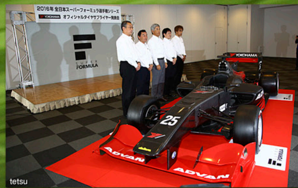
長年にわたって日本のトップフォーミュラを支えてきたブリジストンタイヤは今年限りとなり、2016年度からはYOKOHAMAがスーパーフォーミュラのサプライヤーとなる。